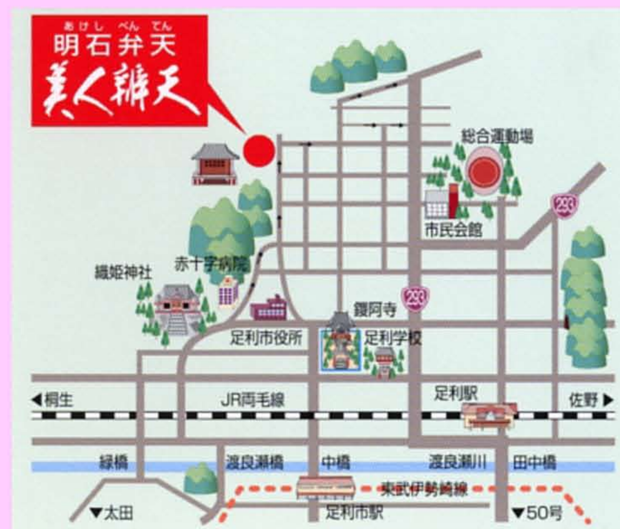
美人弁天(厳島神社)