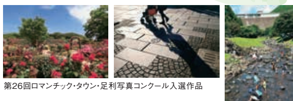
第26回ロマンチック・タウン・足利写真コンクール入選作品